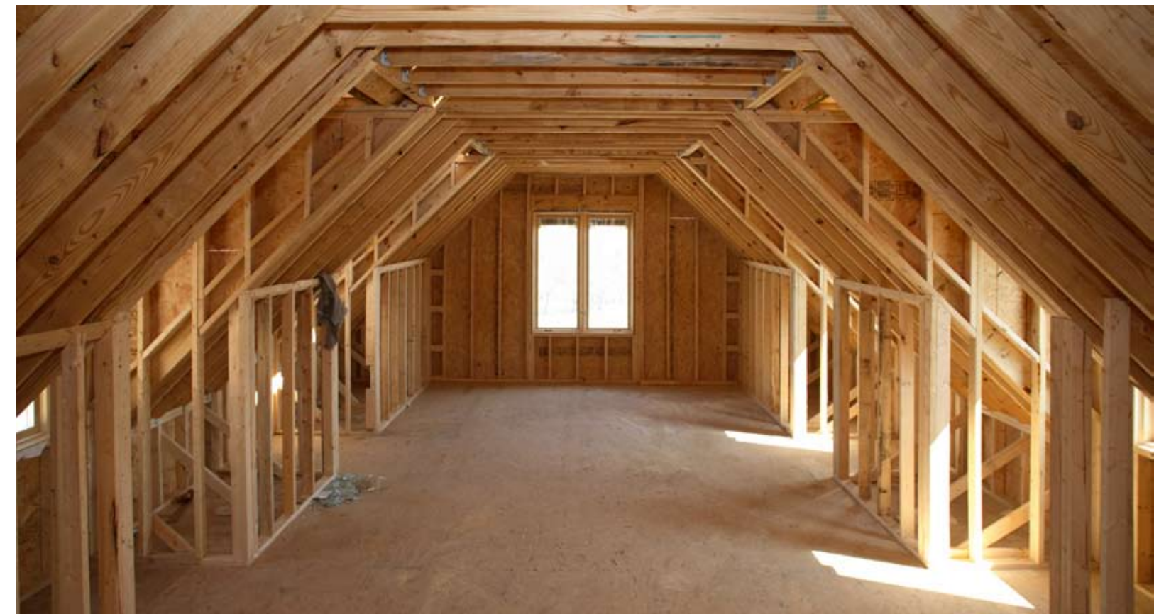
| Trockenbau - Spitzboden neu errichtet