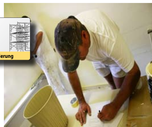
| Auch Malerarbeiten