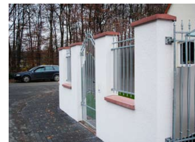
| Private Objekte - Neuer Eingangsbereich