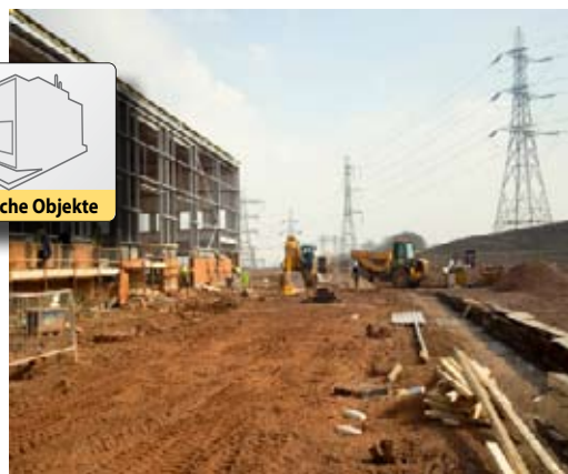
| Stahlrohrbau für Gewerbebetriebe