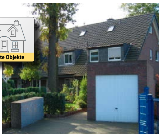
| Ein- und Mehrfamilienhäuser