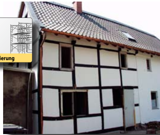
| Sanierung eines Fachwerkhouses