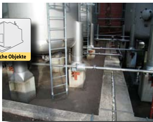
| Arbeiten an einer Kesselanlage